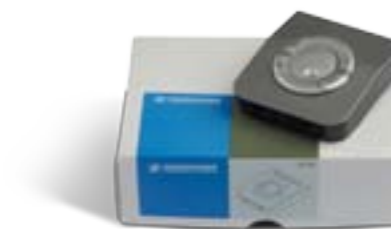
Caja de interfaz UI770