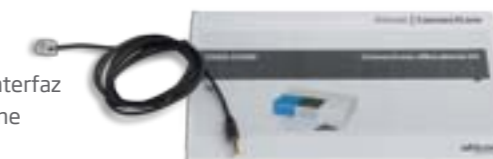
Cable de interfaz ConnectLine