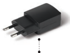
Prise d'alimentation électrique*